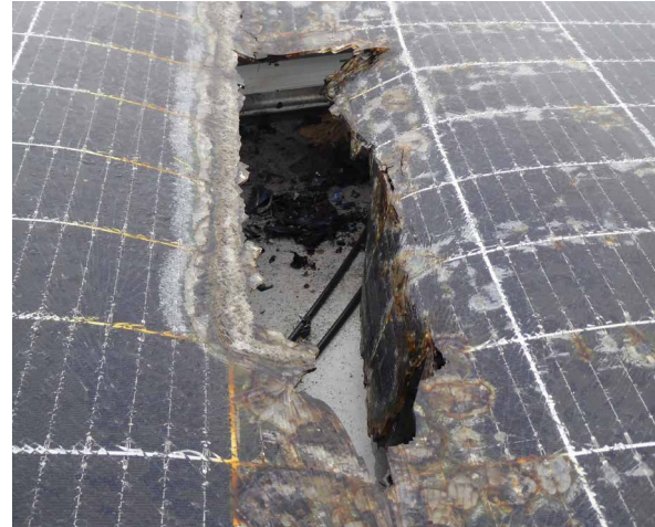
Bild 1: Schaden nach einem im PV-Modul generierten Lichtbogen

baurechtlichen Verordnungen und Normen geben keine abschließenden Antworten. Was aber immer gilt ist, ein Brand benötigt Sauerstoff (immer vorhanden), eine Zündquelle (PV-Anlage im Fehlerfall) und einen brennbaren Stoff (z. B. brennbarer Dachbaustoff).